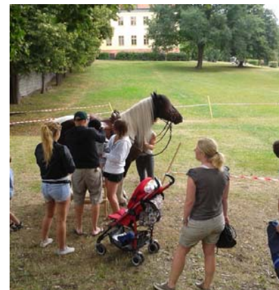
Familjeonsdagarna i Edsvik är populära för de ridintresserade.