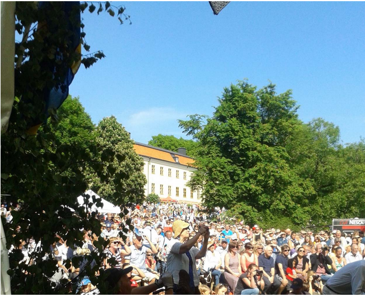
Nationaldagen 2013 – en varm solig dag lockade tusentals besökare!