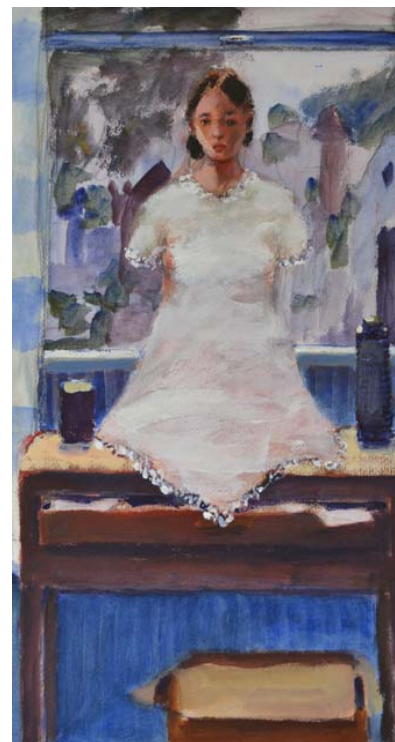
Wallensköld kallar detta verk för Baignolles (något beskuren).

Ibland är människorna som element i en stillebenmålning.