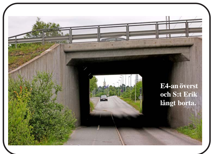
E4-an överst och S:t Erik långt borta.

Samma fenomen som detta illustrerar, visar sig gång efter gång inom den allt våldigare förvaltningskåren och dess organ, som det här landet begåvats med av tidigare och nuvarande regeringar.